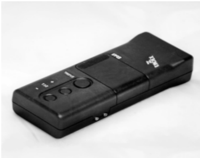
Fig.1 : EMDEX II

L'analyse de données, conjointement qualitative et quantitative, dans une optique de choix optimaux de descripteurs, statistiquement pertinents, et en nombre restreint, est un champ d'étude qui reste ouvert et qui aurait des applications qui dépassent largement le cadre de cette étude.